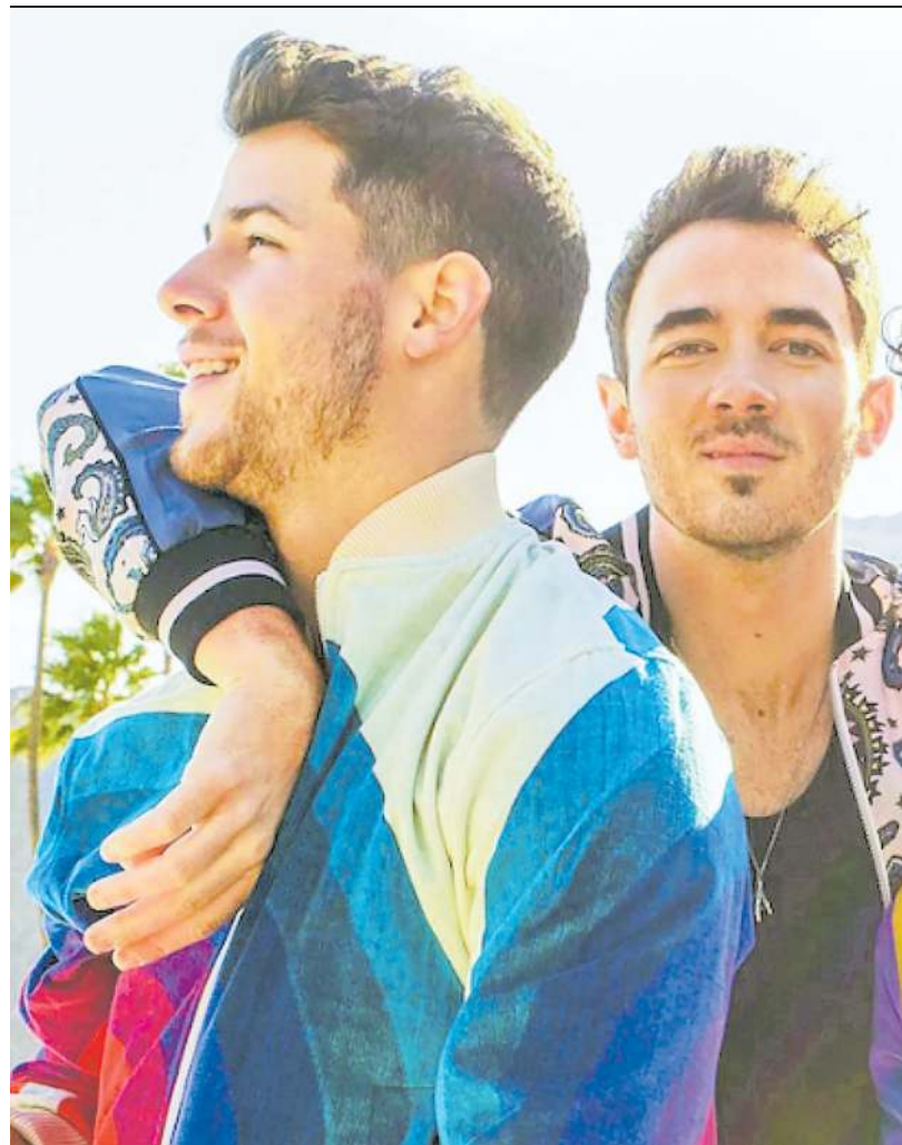
▲ I Jonas Brothers sono questa sera alle 21 al Mediolanum Forum di Assago, via Di Vittorio 6, ingresso 59,80-48,30, telefono 892.101

Sono maschere che deformano il viso, quelle usate dalla compagnia Familie Floez, come a voler mostrare la mostruosità dell'animo umano. Succede così anche in Hotel Paradiso , da oggi a domenica al Menotti. Un piccolo albergo di montagna gestito con pugno di ferro dalla anziana capo-famiglia viene turbato da una serie di eventi: il figlio sogna il vero amore e combatte con la sorella per mantenere il controllo dell'hotel, la donna delle pulizie è cleptomane e il cuoco macella non solo animali, ma anche esseri umani. Inizia un turbine noir dalle conseguenze imprevedibili, in uno spettacolo grottesco, divertente e drammatico.